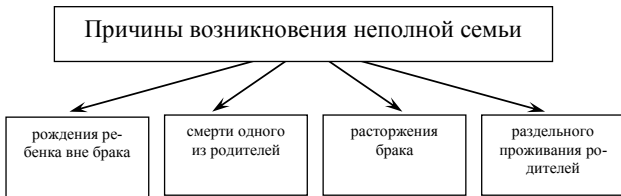
Схема 4. Причины возникновения неполной семьи

Неполная семья возникает в силу разных причин (схема 4).