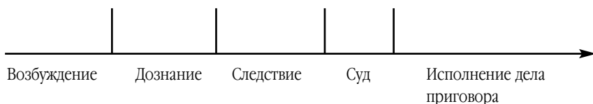
Рис. 1 Схема стадий процесса.

Одной из существенных ошибок при подготовке законопроекта о ювенальной юстиции была бы попытка воспринимать и формализовать ее по аналогии с общей юстицией (например, уголовной). Речь идет об использовании схемы, в рамках которой обычно рассуждают об общей юстиции (схемы стадий процесса, и, соответственно, органов, отправляющих установленные законом функции (рис. 1).